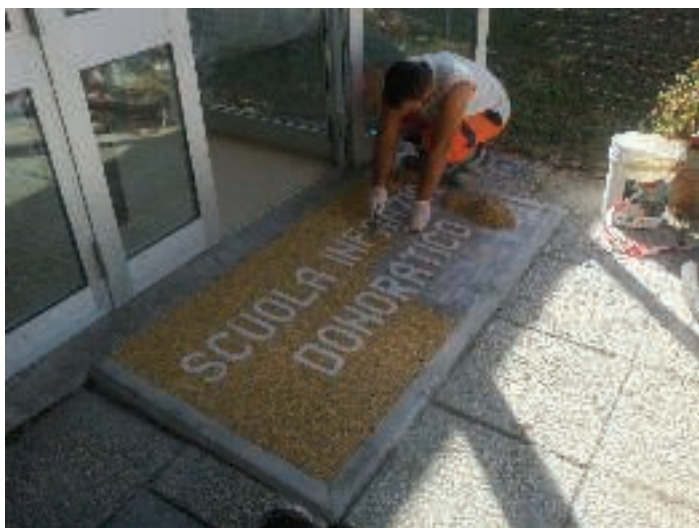
Fig. 8 – Esempio di finitura in marmodrain

Oltre alla nuova pavimentazione sarà realizzata una nuova recinzione sul lato est del parco in sostituzione a quella già esistente. Questa recinzione sarà installata su di un cordolo in cemento armato appoggiato sul terreno delle dimensioni di 20cm x h 30cm.