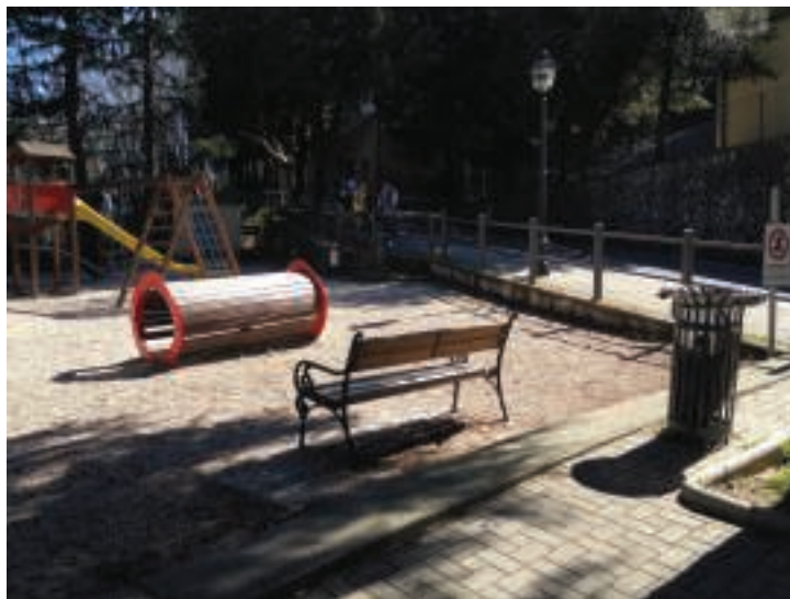
Fig. 6 – Immagine 3