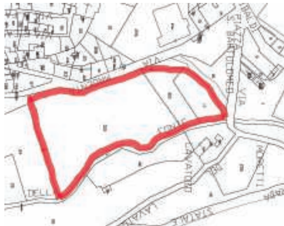
Fig. 1 - Estratto mappa catastale Foglio 23 Comune di Monterotondo Marittimo

Il parco pubblico oggetto dell'intervento è ubicato all'interno del centro abitato di Monterotondo Marittimo (GR) in Via Magenta ed è individuato al catasto del Comune di Monterotondo al foglio 23 particelle 17, 313 e 315.