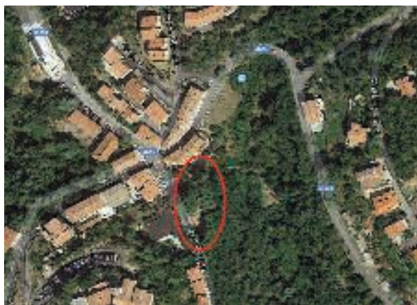
Fig. 2 - Immagine satellitare area di intervento