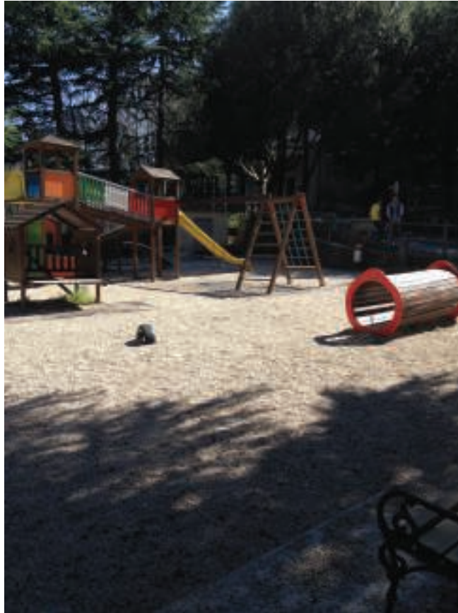
Fig. 5 - Immagine n. 2