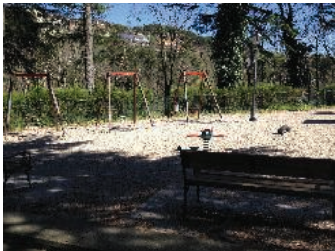
Fig. 4 - Immagine n. 1

Il fondo del parco è costituito da terra battuta e ghiaietto bianco. Di seguito si riportano alcune immagini del parco: