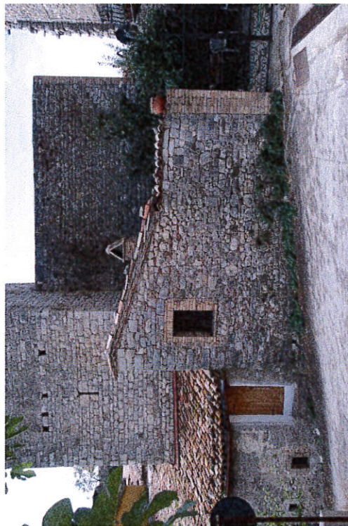
Vista del complesso di abitazioni che, nel corso del tempo, si sono addensate e addossate al complesso murario delle Torricelle. Fotografia ripresa da Via Salira Sasso