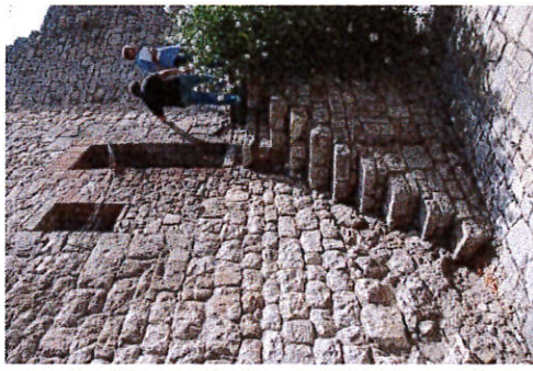
Particolare della scala di accesso e del sistema di accesso nel suo complesso con piano di calpestio e ingresso. Attualmente privo di parapetto di sicurezza.