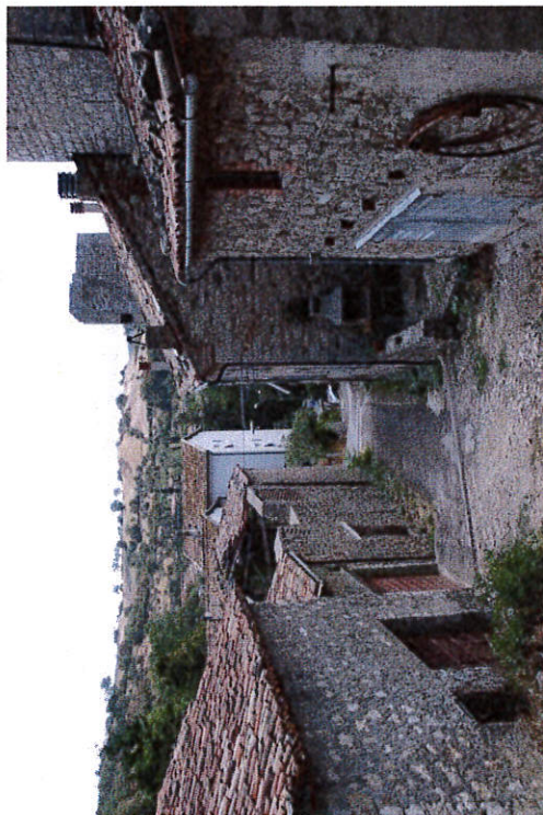
Il complesso delle Torricelle visto dalla sommità di Via Salira Sasso