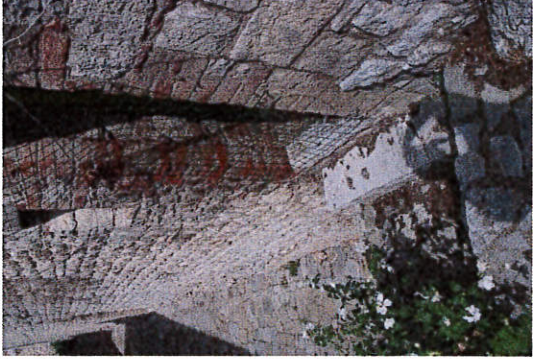
Particolare del piano di calpestio posto al livello dell'ingresso al sistema murario. Attualmente sia l'ingresso che il piano risultano poco curano e in situazione di quasi inesistente sicurezza.