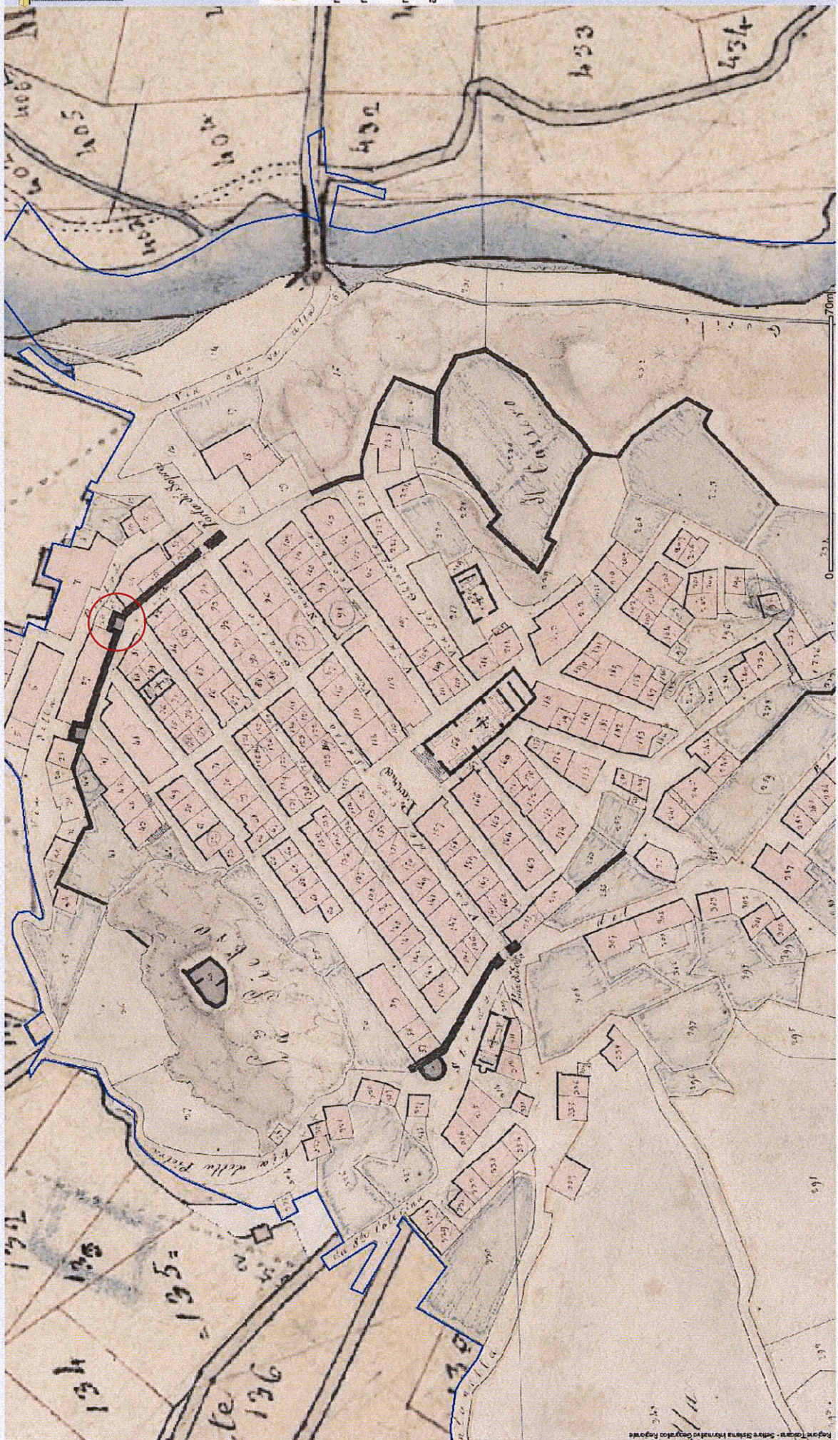
Immagine tratta da sito internet Castore (Catasti storici regionali). Si individua la cinta muraria della città di Roccalbegna e, cerchiato di rosso, il complesso dell'edificio delle Torricelle.