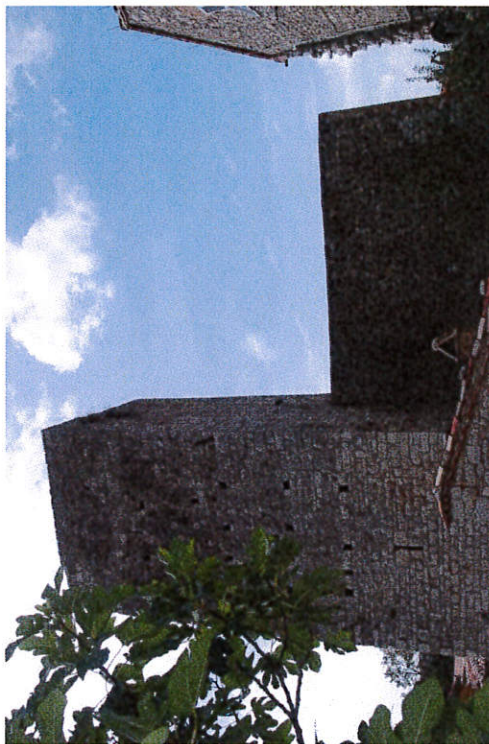
Vista del prospetto principale che si affaccia su Via Salira del Sasso