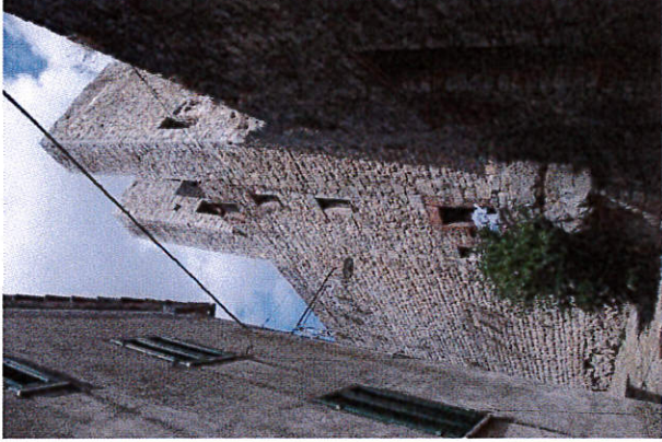
Vista da Via dei Torrioni del complesso murario. Sulla sommità i due varchi per il camminamento in quota.