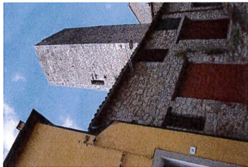
Vista da Via Salira Sasso: sul prospetto in primo piano si può notare l'apertura dalla quale si accedeva al camminamento posto in cima al sistema di cinta muraria che era presente a Roccalbegna.